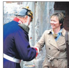
Kaiser Wilhelm I. begrüßte Stades Bürgermeisterin Silvia Nieber mit einem angedeuteten Handkuss

● Die Festung Grauerort wurde von 1869 bis 1879 von den Preußen zum Schutz vor feindlichen Schiffen auf der Elbe errichtet. Bereits im deutsch-französischen Krieg 1870/71 war die Festung einsatzbereit. Die Festung wurde jedoch nie in Kampfhandlungen verwickelt.